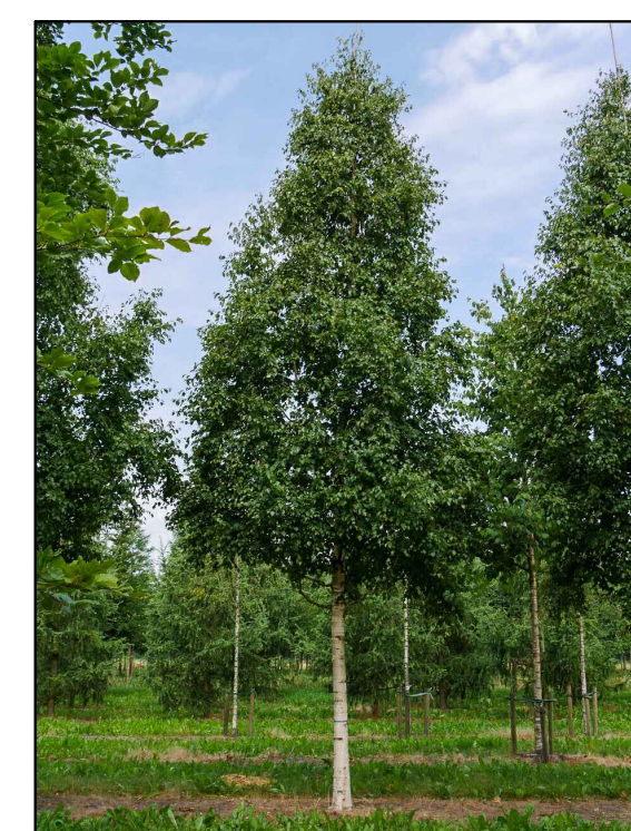
G - Goutberk Betula ermanni Holland