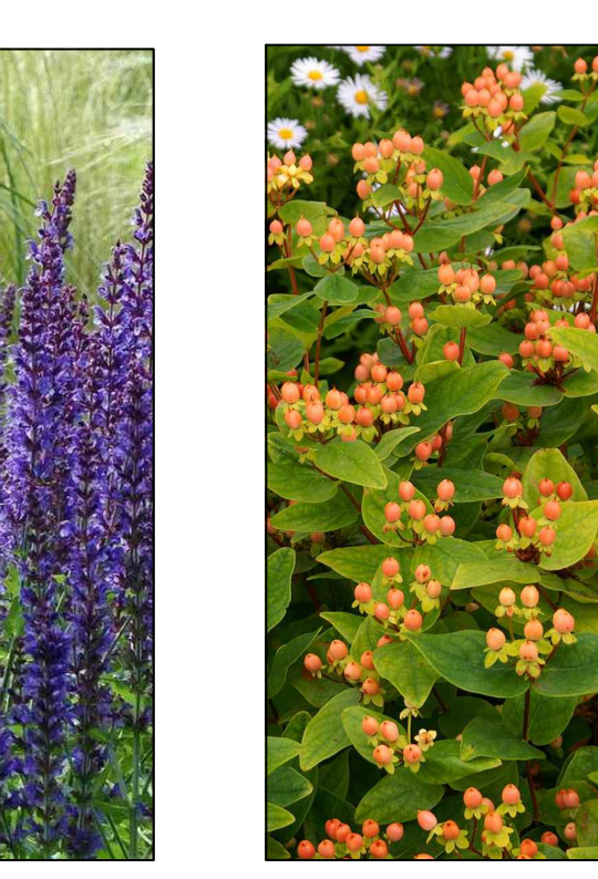
Hertshooi Hypericum inodorum Orange Gem