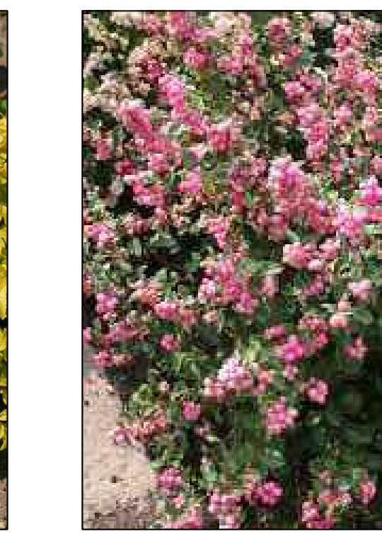
Doorenbos Symphoricarpos Pink Blizzard