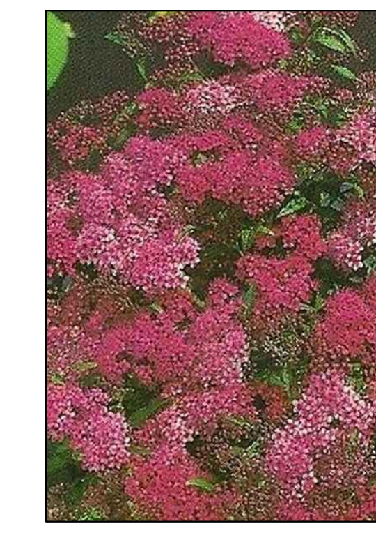
Spierstruik Spirea japonica dart's red