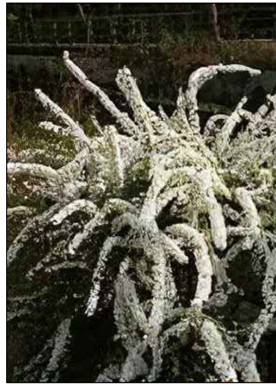
Spierstruik Spirea Thunbergii