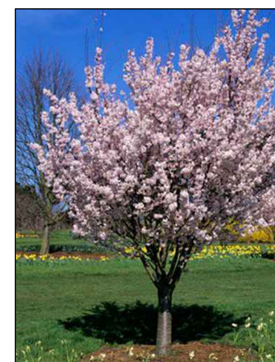
D - Sierkers Prunus Pandora