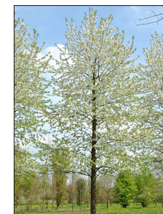
I - Zoete kers Prunus avium