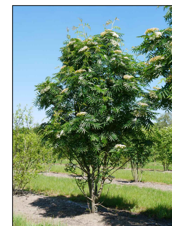
E - Lijsterbes Sorbus DoDong