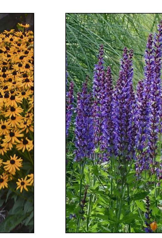
Salie Salvia nemorosa 'Mairacht'