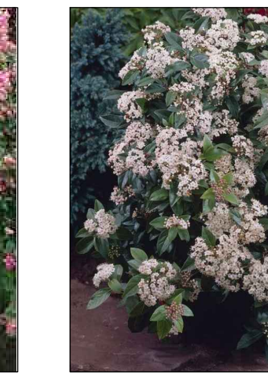
Sneeuwbal viburnum Tinus solitair