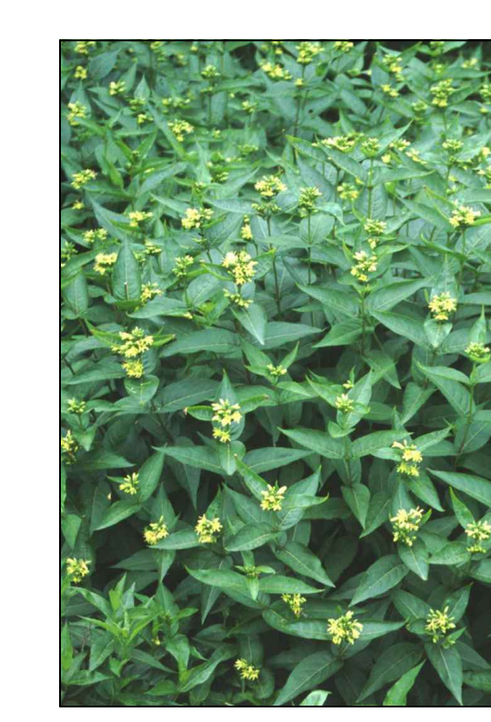
Boskamperfoeie Diervilla sessilifolia Butterfly