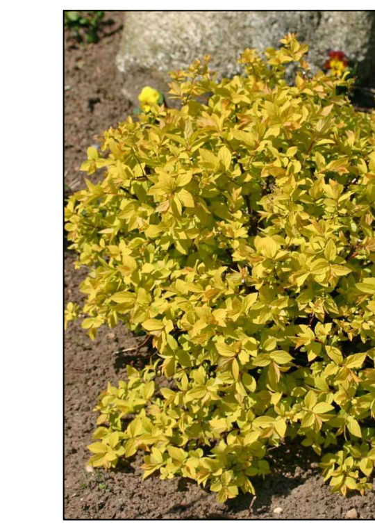
Spierstruik Spirea japonica Golden princess