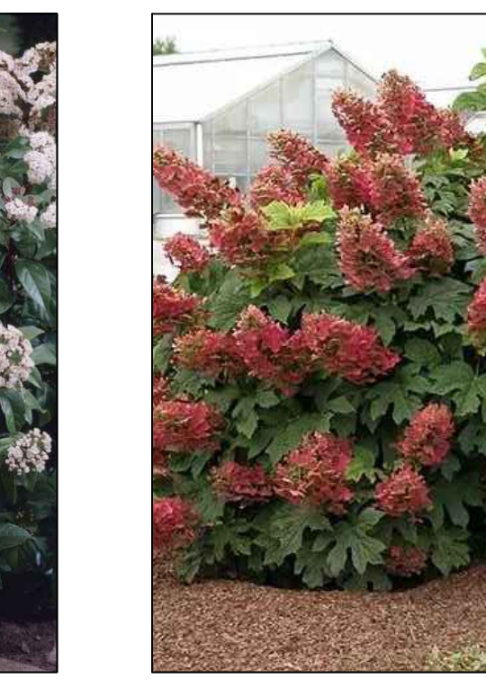
Eikenbladhortensia Hydrangea Quercifolia (solitair)