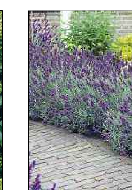
Lavendel Lavandula angustifolia Hidcote