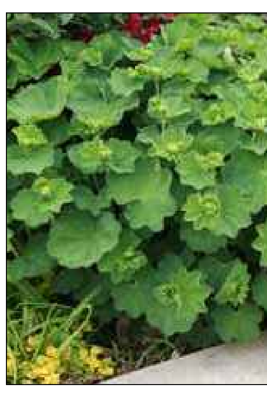
Vrouwenmantel Alchemilla mollis