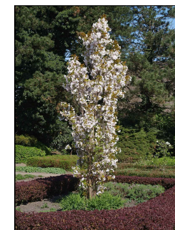
F - Japanse sierkers Prunus serrulata Amanogawa