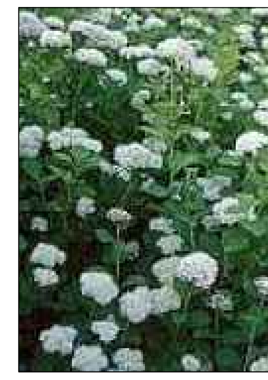
Spierstruik Spirea betulifolia Tor