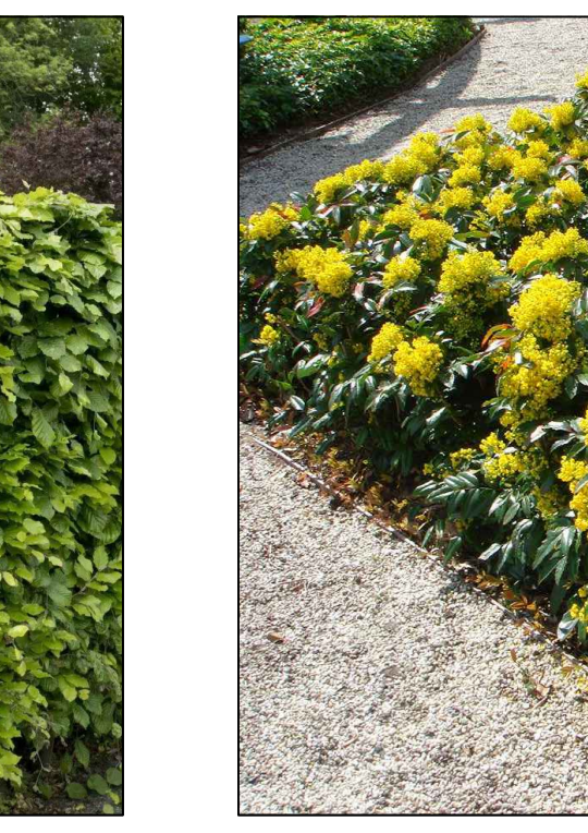
Mahonie struik Mahonia hilly