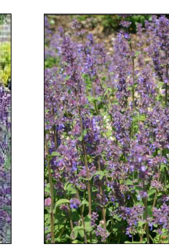
Kaffierkruid Nepeta racemosa Grog