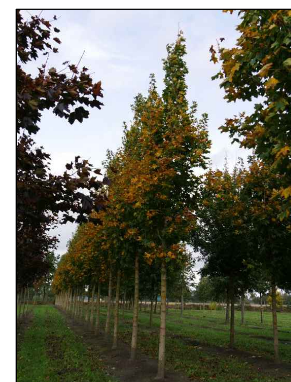
A - Noorse esdoorn Acer platanoides emerald queen