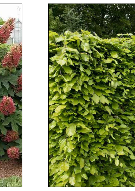
Beukenhaag Fagus sylvatica