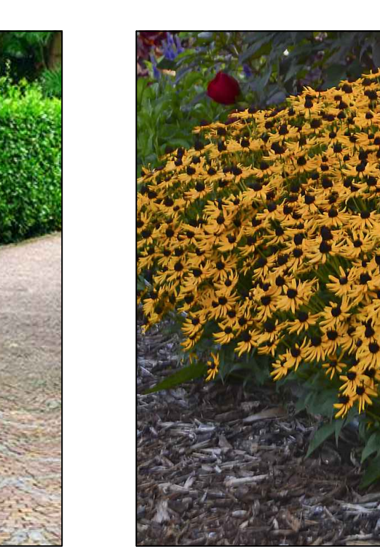
Zonnebloem Rudbeckia ligula lila Goldstar