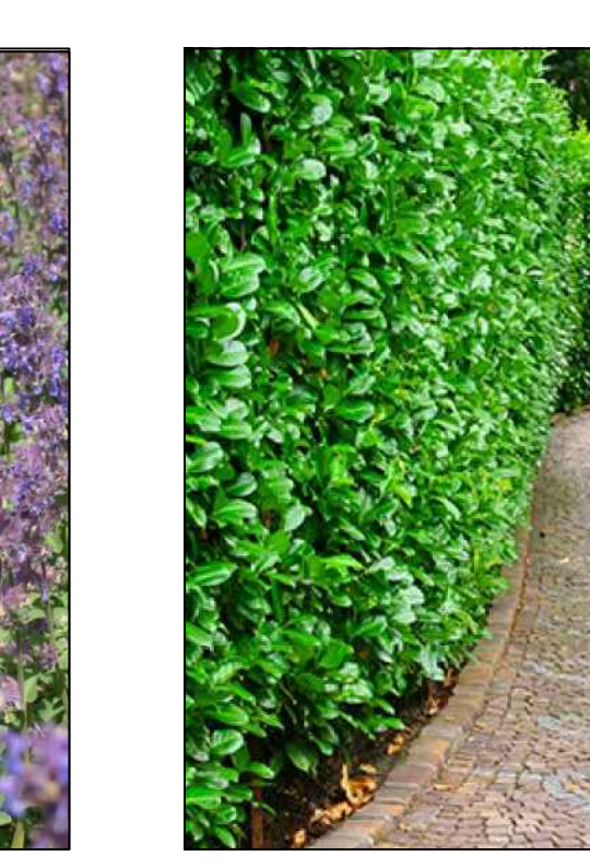
Laurier Prunus laurocerasus Genolia marblon