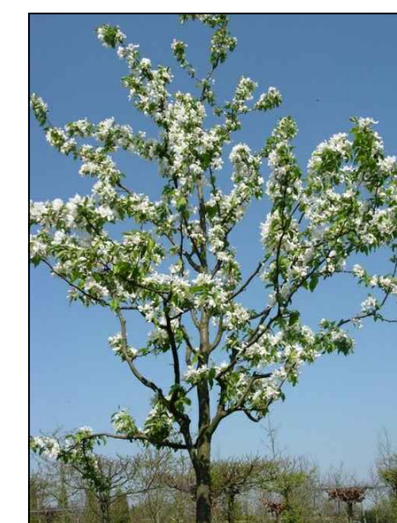
H - Sierappel Malus baccata