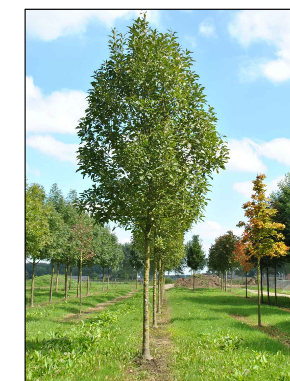
C - Eenbladige es Fraxinus excelsior Diversifolia