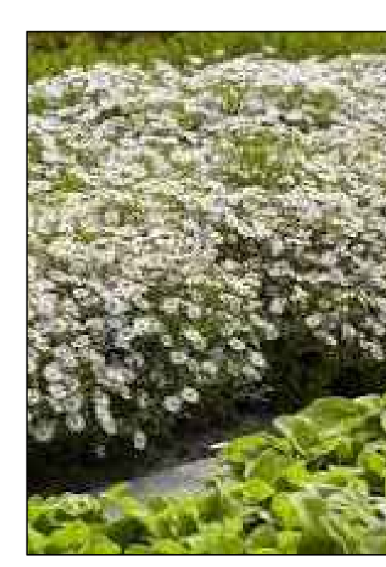
Herfstmantel Aster ageratoides Asran