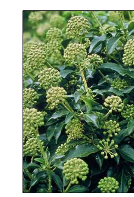
Struikklimop Hedera arborescens