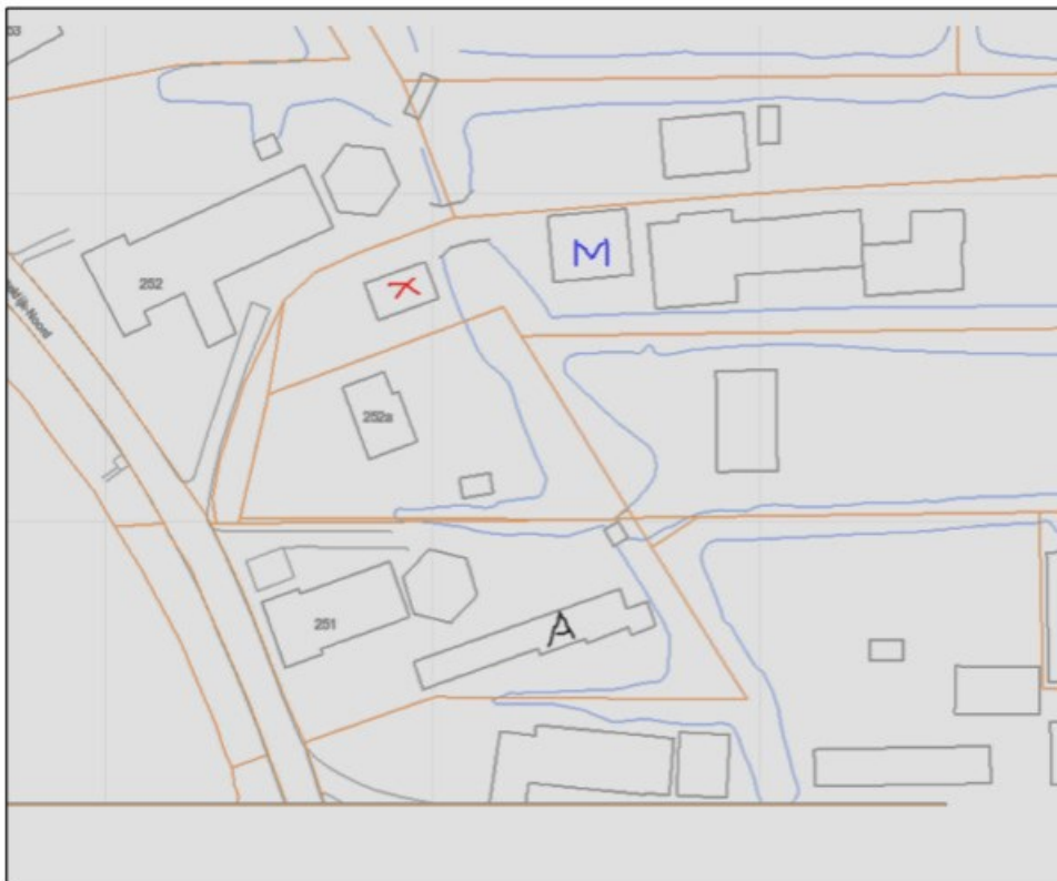
De bebouwing in de omgeving

Het bedrijfsmatig houden van schapen valt onder de Wet geurhinder en veehouderijen. In dit kader dient de voorgenomen activiteit te worden getoetst op afstandsnormen voor geur. De woning op nummer 252a is een bedrijfswoning. Hiervoor gelden geen afstands- en geurbelastingsnormen. Binnen 50 meter van woningen is het niet toegestaan mest op te slaan. Binnen 25 meter van woningen mogen geen schapen gehouden worden. De figuur hieronder geeft de posities weer van de verschillende woningen en stallen in de omgeving. De stal aangegeven met een "X" staat op minder dan 25 meter van de woning op nr. 252. Hier mogen geen schapen gehouden worden. De stal aangegeven met een "M" ligt van de overgebleven stallen het dichtst bij woningen die niet bij het bedrijf zullen horen. Voor die stal zijn indicatieve berekeningen uitgevoerd voor de geurbelasting op de woning 252 en het bijgebouw van nr. 251 (aangegeven met "A"). Deze berekeningen met V-stacks Vergunningen zijn uitgevoerd voor het geval dat de 350 schapen gehuisvest worden in stal "M". De uitkomsten van die berekeningen zijn weergegeven in de bijlage. Het blijkt dat onder genoemde voorwaarden de geurbelasting op de woning van nr. 252 te hoog is (8,5 met 8 als norm). In deze stal kunnen de schapen dus niet zonder maatregelen (b.v. beperking aantal) gehouden worden. In de stallen (noord)oostelijk gelegen van deze stal kunnen de schapen, gezien de afstand en de berekeningen, wel gehouden worden.