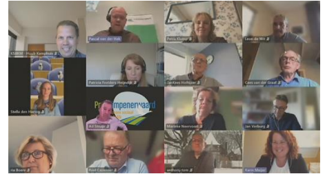
19 mei: Bespreking second opinion business case gemeentekantoren

De RKC hield diverse interviews voor het onderzoek naar doorwerking en evaluatie.