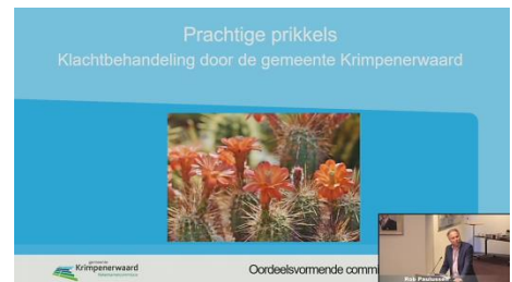
22 juni: Presentatie onderzoek klachtbehandeling