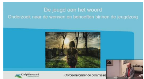
12 oktober: Presentatie onderzoek jeugdzorg