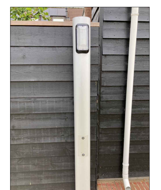
LICHTMAST TYPE SLIMLIGHT