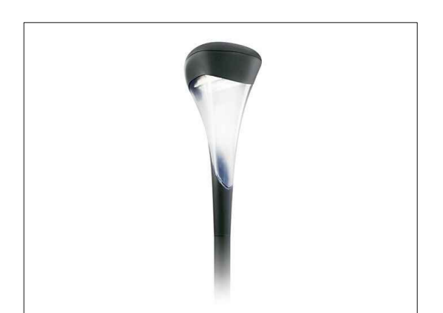
LICHTMAST TYPE URBANSTAR