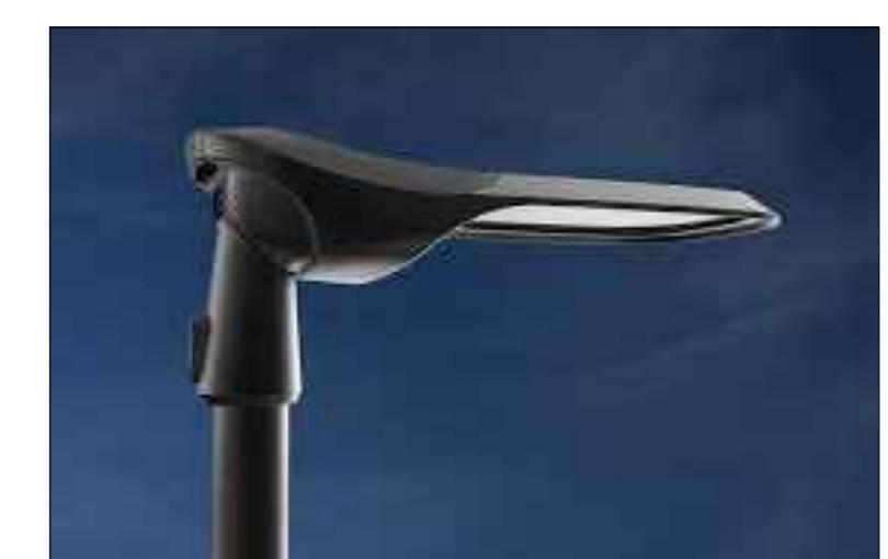
LICHTMAST TYPE ALEXIA